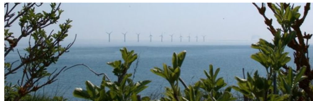
Bovbjerg Fyr - lige til kanten har opdateret sit coverbillede. 12. maj · 🌐

Et bredt samarbejde på Samsø har på otte år formået at omstille øens energiproduktion fra olie og kul til vedvarende energi. Lokalt engagement har skabt en slags social energibevægelse. I dag producerer øen mere ren energi, end den forbruger, og sender den overskydende energi til fastlandet. Samsø har nu en international førerposition som energirigtig forskningsø, hvorfra Samsø EnergiAkademi deler viden og erfaringer med resten af verden.