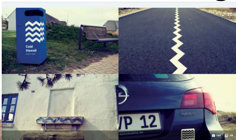
Cold Hawaii - to byer, én bølge...